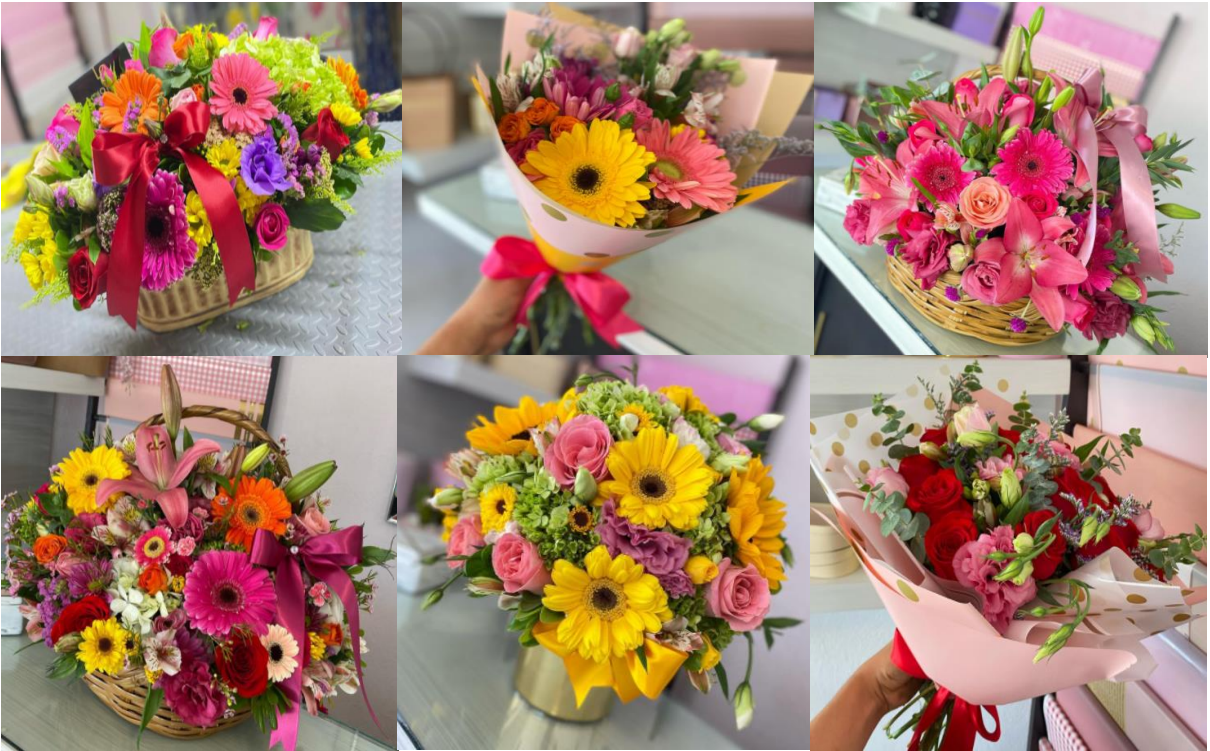
Figura 1. Diseño de algunos arreglos realizados en FLORARTE.