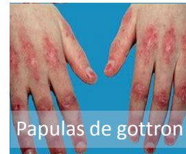
Papulas de gottron