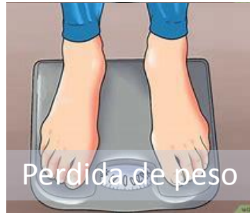
Perdida de peso