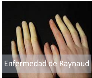
Enfermedad de Raynaud