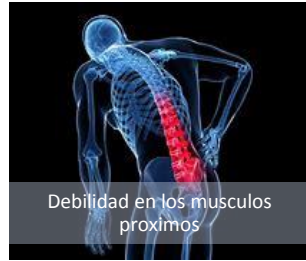
Debilidad en los musculos proximos