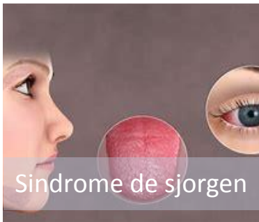
Sindrome de sjorgen