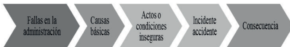
Figura 2. Secuencia accidente. (HERNÁNDEZ ZÚÑIGA, MALFAVÓN RAMOS, & FERNÁNDEZ LUNA, 2005)

Con relación a las fallas en la administración, estas se refieren a la evidente falta de planeación, organización, dirección y control en los procesos de seguridad y salud laboral, lo que deja como resultado la incorporación de estándares inadecuados y programas de SST erróneos que posibilitan la ocurrencia de AT y EP.