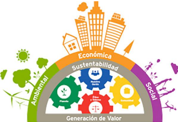
Diferente enfoque de la responsabilidad social

Este significado de RS surge de conjugar los ámbitos económicos, el medio ambiente y la relación de personas bajo un marco de gobernabilidad.