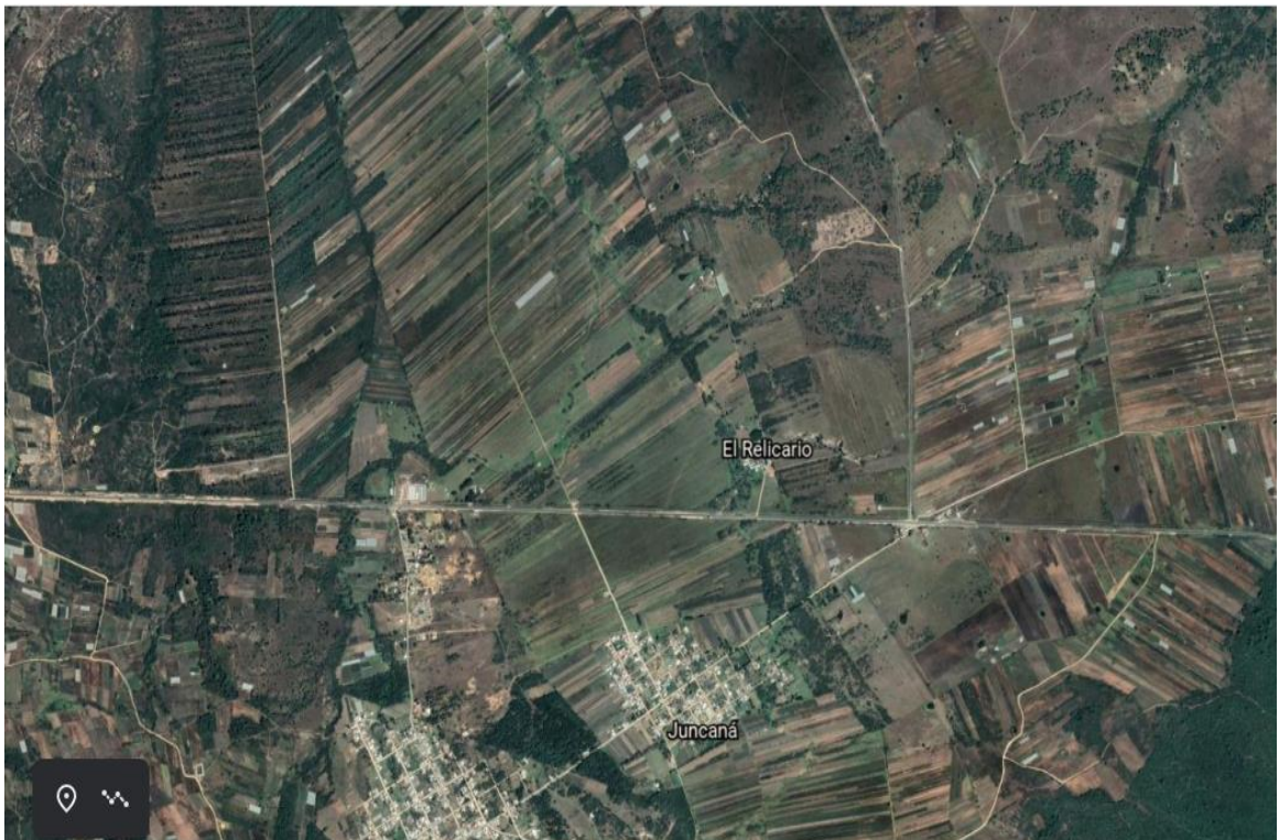
Granja el relicario, Juncana, La trinitaria, Chiapas

La presente investigación se llevara a cabo en el municipio de La Trinitaria, Chiapas en la granja el relicario ubicada en la localidad de Juncana cuyas coordenadas geográficas son: 16°09'06"N 91°55'43".