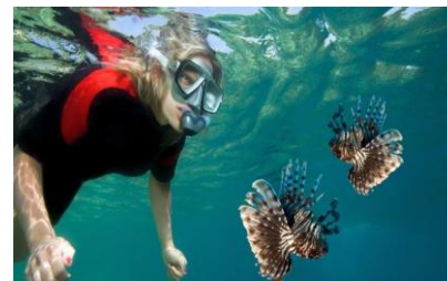
Investigación de campo