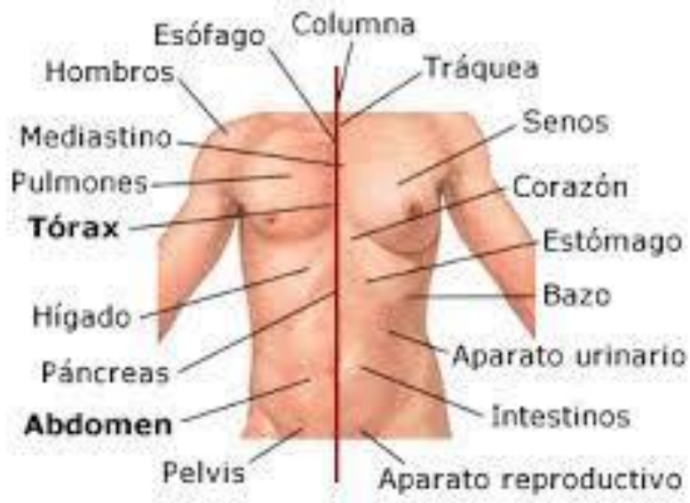
Partes del tronco

posteroinferior. El pubis permanece cartilaginoso y elástico, lo que permite aumentar el diámetro transversal de la pelvis al momento del parto. Es importante tener presente la época de osificación de los huesos, esto quiere decir que no son totalmente compactos, sino que tienen un núcleo donde se sigue formando hueso para ir aumentando de tamaño a medida que crecemos.