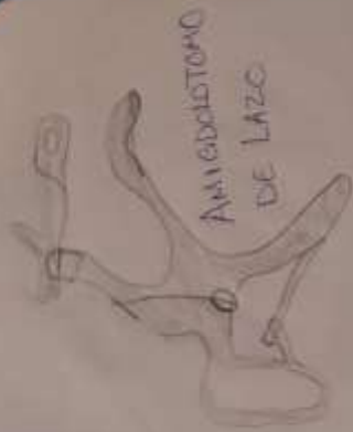
AMIGDOSTOMO DE LAZO