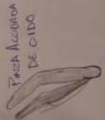
Pinza Accedora DE OIDO