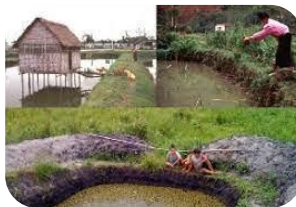
acuicultura de reursos limitados