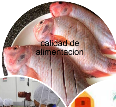
calidad de alimentacion