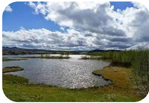
aguas continentales e interiores