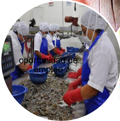
oportunidad de empleo