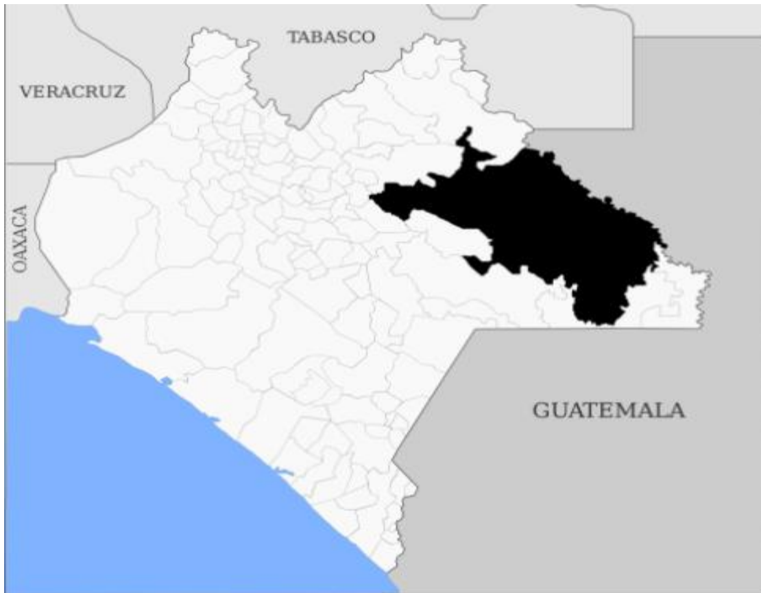
Cuadro 1 mapa de estado de Chiapas y localización del municipio de Ocosingo Chiapas.