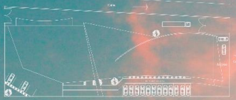
PLANTA DE CONJUNTO