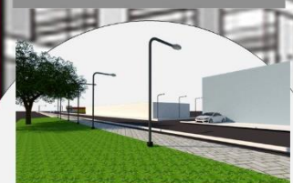
9 avenida Pte. sur

solución a la problemática : • Colocación de alumbrado publico • Colocación de banquetas anchas ya que el terreno y el espacio lo permite • Colocación de una ciclo via • Jardín a modo de decoración para hacer el espacio mas natural