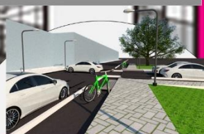
8 avenida Pte. sur

solución a la problemática : • Colocación de alumbrado publico • Colocación de banquetas anchas ya que el terreno y el espacio lo permite • Colocación de una ciclo via • Jardín a modo de decoración para hacer el espacio mas natural • Pasos de cebra con rampas para discapacitados