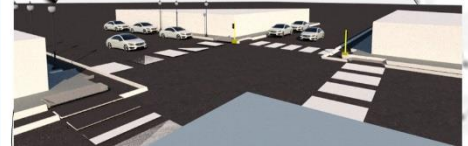
7 avenida Pte. sur