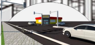
10 avenida Pte. sur

solución a la problemática : Se colocaran semáforos y pasos de cebra en cada una de las esquinas que se encuentran , los pasos de cebra cuentan con rampas para poder maniobrar a personas con sillas de ruedas