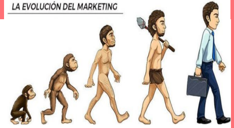
LA EVOLUCIÓN DEL MARKETING

Ya que buscó la manera de delimitar tareas, tener un líder, tomar decisiones y planear