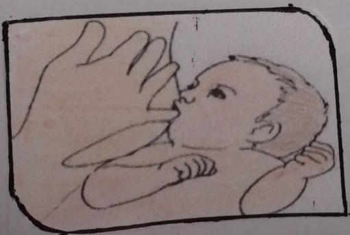
Como retirar el Pecho