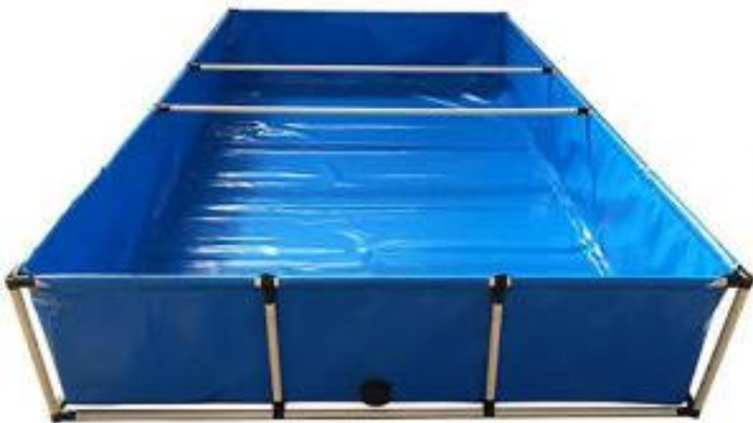
Estanque para los peces