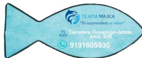
Tarjeta de presentación