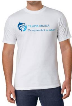
Uniforme para el personal