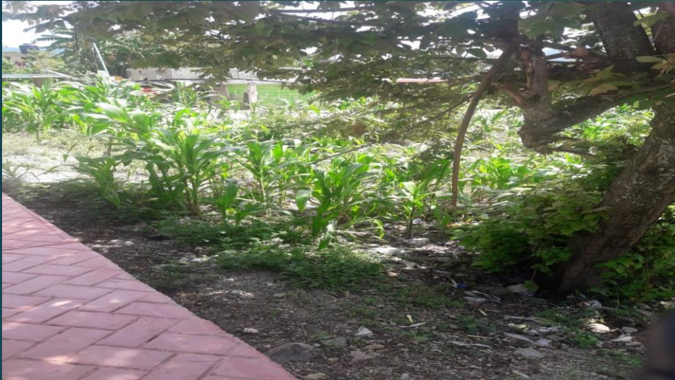
Vista al Norte