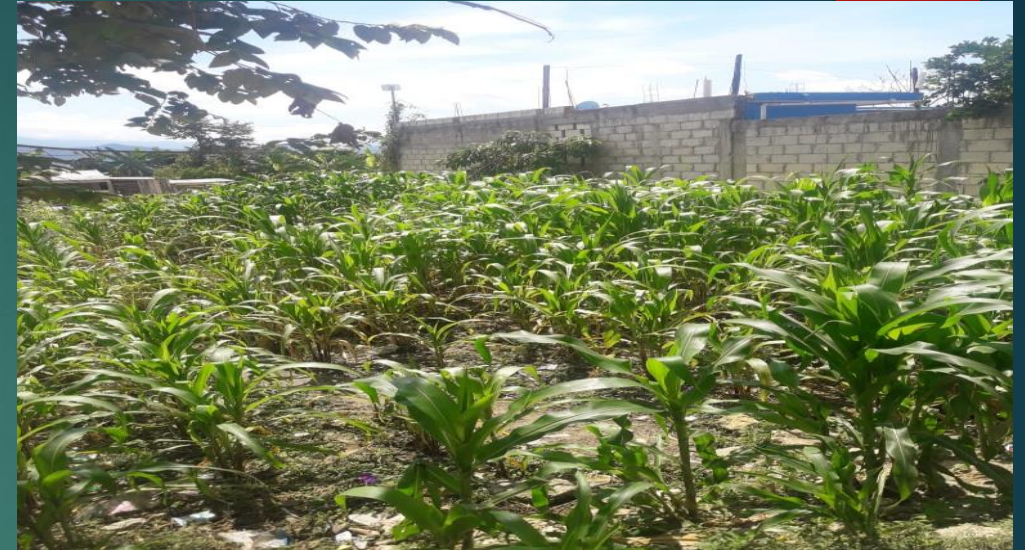
Vista al Este