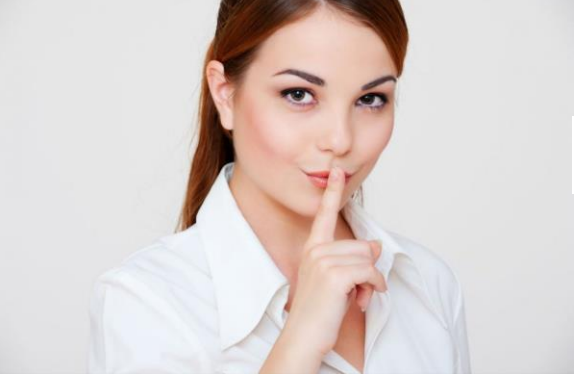
Técnica de la observación