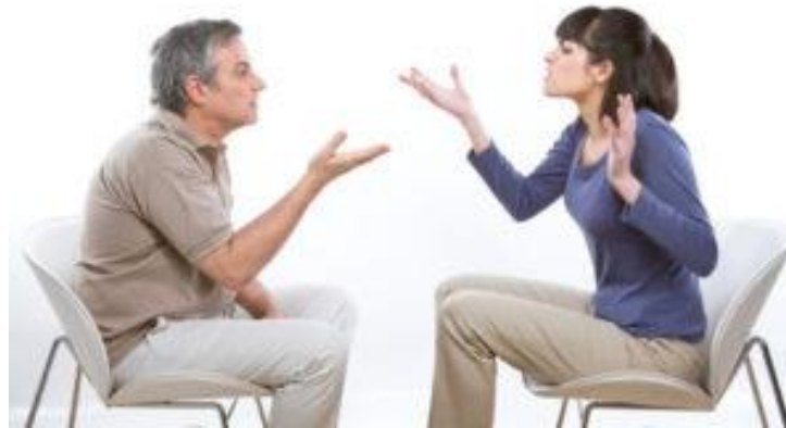
Técnica del uso del agrado