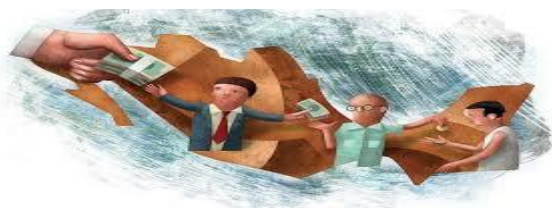
Forma de intervención del estado en la sociedad civil.

Se adoptó el modelo de economía abierta para reorientar la política económica en México, provocó desequilibrios en México en el crecimiento y la distribución interna de la riqueza.