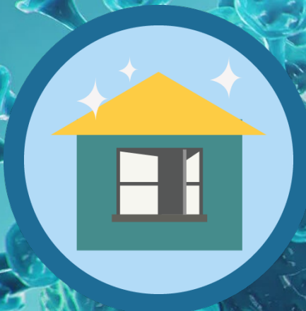
Quedarse en casa