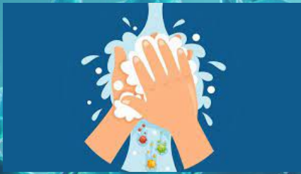
Lavarse las manos

Dereck Harper Narcia - 15 de mayo de 2021