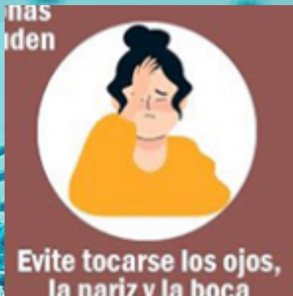
evitar tocarse ojos, la nariz y la boca