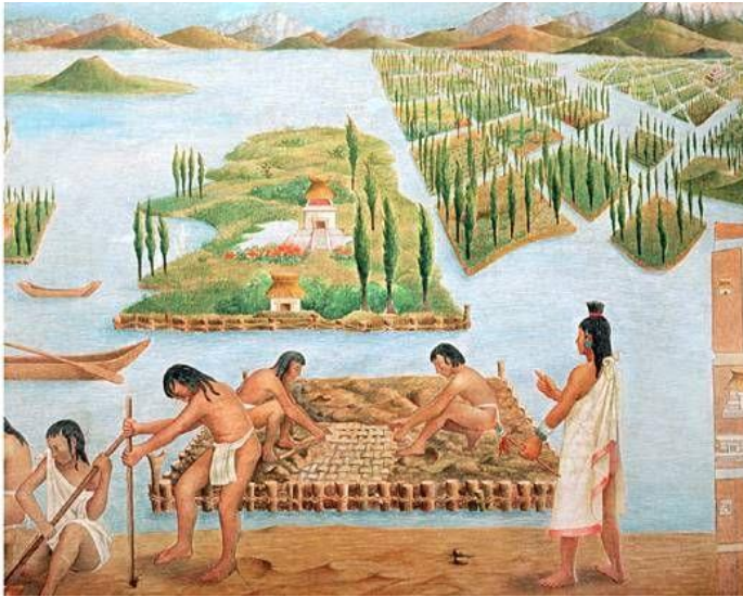
Chinampas, civilización azteca.

a transformación de cazadores a agricultores, no fue un proceso fácil. Es claro que esta transición debe haber implicado problemas severos en el abasto de alimentos, y un deterioro grande en la calidad de las proteínas ingeridas por los primeros pobladores. Así, podemos visualizar el establecimiento de los primeros grupos humanos en el continente americano, como un largo ciclo de lenta expansión poblacional, seguido por otro de