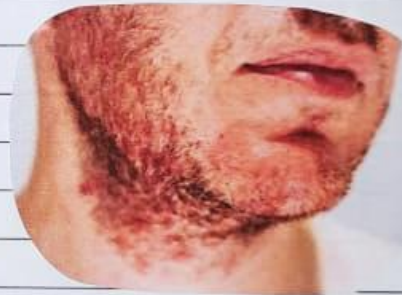
■ Dermatitis seborreica