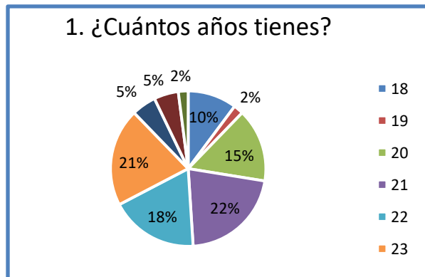
Ilustración 1 Distribución por edad

Obteniendo así una escala de edades que asciende de 18 años a 26 años, las cuales se interpretan en que los encuestados en su mayoría que han contestado son las de 21 años representados en un 21%, para los datos específicos los cuales se representan en la gráfica de pastel.