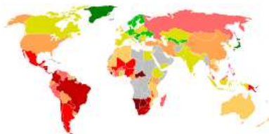
Índice de Gini