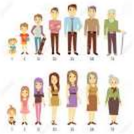
Edad y sexo