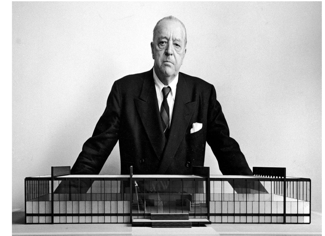
➤ ARQUITECTO ALEMÁN MIES VAN DER ROHE