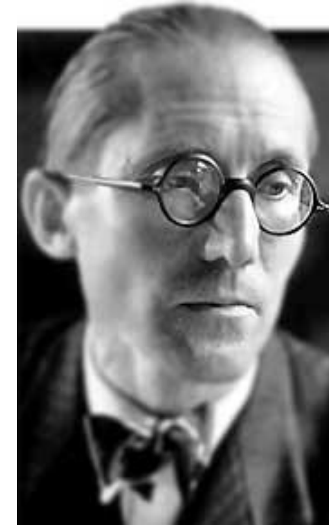
➤ FRANCO-SUIZO LE CORBUSIER