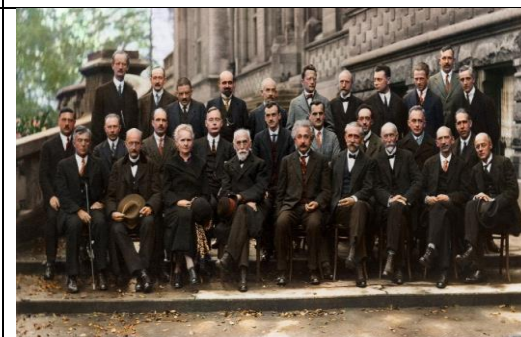
SOLVAY CONFERENCE 1927 created by postmodern.com

DERECHO INTERNACIONAL DE LOS DERECHOS HUMANOS: Se establecen claramente los derechos civiles, políticos, económicos, sociales y culturales básicos de los que todos los seres humanos deben gozar.