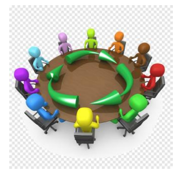
Imagen ideal vs. Imagen proyectada

Aquel proceso de cambio físico-psicológico.