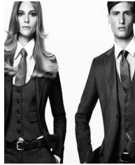
Imagen física: es la percepción que se tiene de una persona.