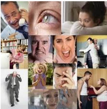
Comportamiento de apoyo o rechazo