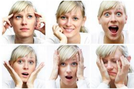
actitudes favorables o desfavorables