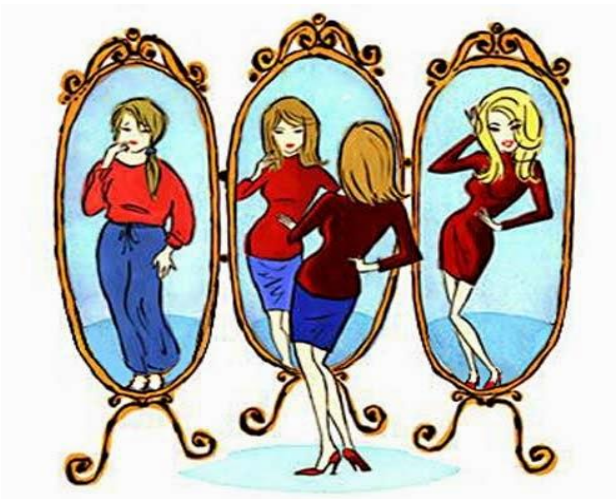
Figura, representación, apariencia