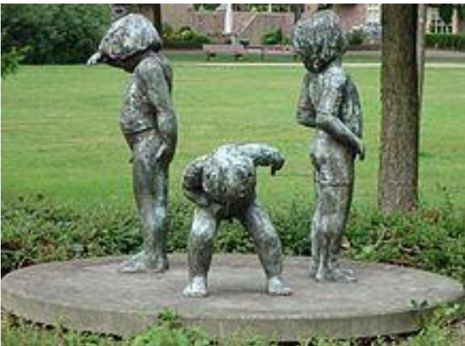
Descubrimiento del cuerpo