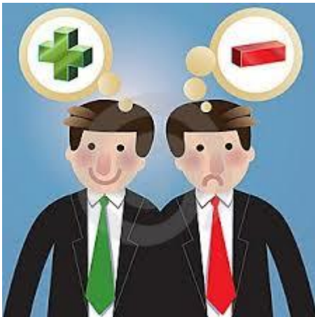
Sentimiento positivo o negativo