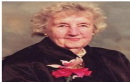
Virginia Henderson 1897-1996

Virginia Henderson nació en 1897 en Kansas. falleció el 19 de marzo de 1996 a la edad de 98 años.