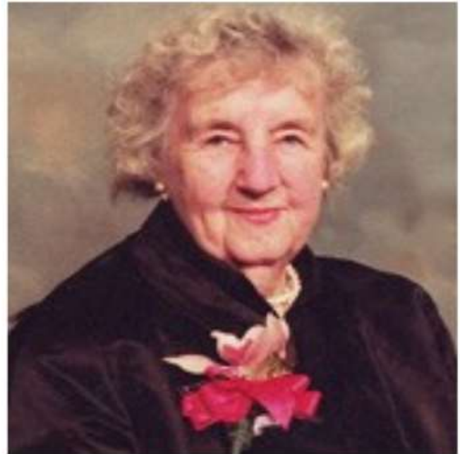
Virginia Henderson 1897-1996

Definió a la responsabilidad de la enfermera como una función propia la de atender al individuo en la etapa de equilibrio de salud o de enfermedad.