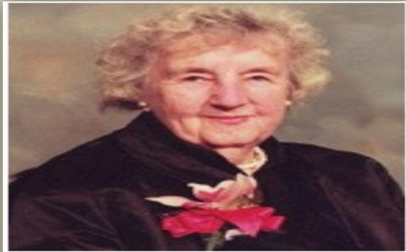
Virginia Henderson 1897-1996

Virginia Henderson nació en 1897 en Kansas. falleció el 19 de marzo de 1996 a la edad de 98 años.