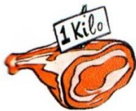
a kilo of meat