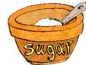
a bowl of sugar