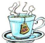
a cup of tea