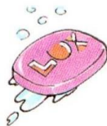
a bar of soap