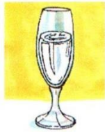
a glass of water