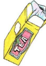
a packet of tea