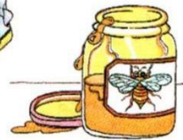
a jar of honey