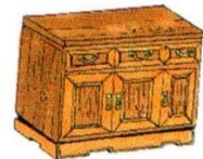
a piece of furniture