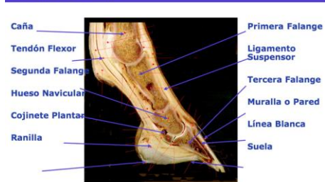
PARTE INTERNA DEL CASCO

La parte interna del casco esta constituida por: caña, tendón flexor, primera falange, segunda falange, ligamento suspensor, hueso navicular, cojinete plantar, tercera falange, muralla o pared, línea blanca, suela y ranilla.