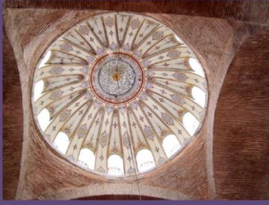
Iglesia de la Virgen del Trono