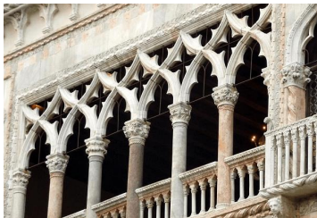
Arcadas llenas de tracería de filigrana. Ca d'Oro, Venecia

Plano e interiores: a diferencia de la arquitectura románica , los complejos de iglesias góticas no están diseñados para equilibrar el este y el oeste. La clara dirección principal se mueve a lo largo de la entrada principal a través de la nave hasta la sala del coro y el ábside. Junto con los brazos del crucero, las iglesias latinas forman el diseño de una cruz latina.