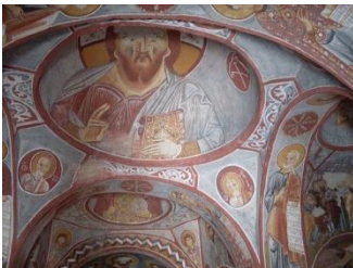
Iglesia Elmali Kilise