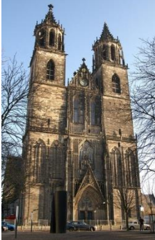
Catedral de Magdeburgo

La primera Catedral de estilo gótico se construyó en suelo alemán con la Catedral de Magdeburgo (Catedral de San Mauricio y Santa Catalina) en 1209. La catedral ottoniana, románica primitiva, fue destruida por un incendio y el nuevo arzobispo Albrecht II experimentó en París el surgimiento de la Catedral de Notre Dame . Inspirado por la nueva arquitectura del cielo, el nuevo arzobispo colocó la primera piedra de la imponente Catedral.