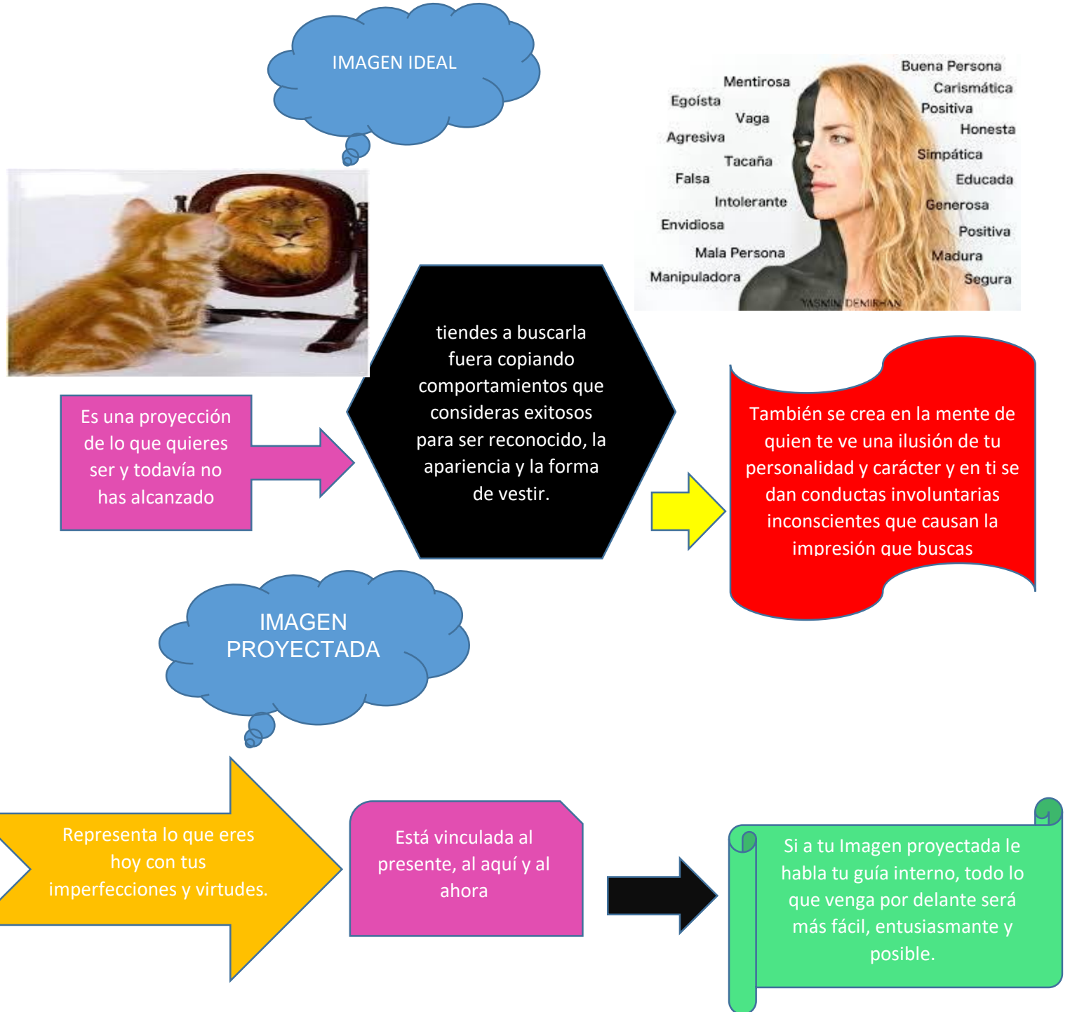
IMAGEN IDEAL VS. IMAGEN PROYECTADA