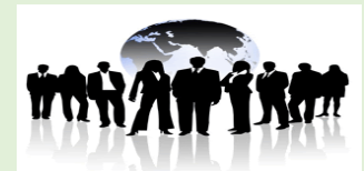
Imagen ideal e imagen proyectada

Según los expertos, todo profesional que ejerza puestos de dirección y desee obtener un mejor desempeño, tanto de sus labores, como de su equipo de trabajo, debe aprender a desarrollar una imagen integral, que abarque factores desde la vestimenta, hasta la identidad y el compromiso.