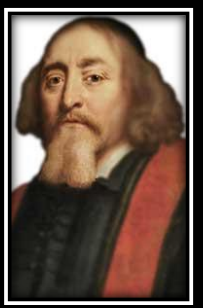
Juan Amos Comenio

Fue uno de los ejes principales de la Ilustración, en sus principios filosóficos y morales y en sus prácticas reformistas