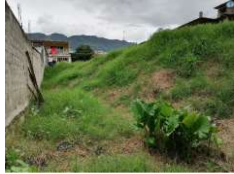
Imagen 1.2 vista posterior