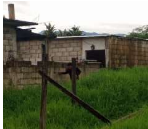
Imagen 1.3 vista lateral derecha