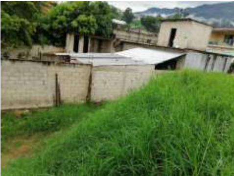
Imagen 1.3 vista lateral izquierda