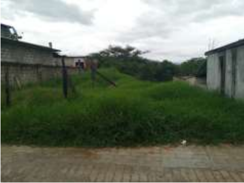
Imagen 1.1 vista frontal del terreno.