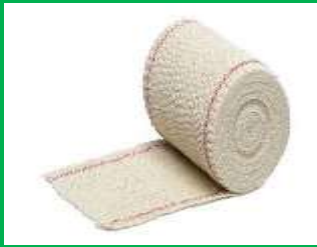
VENDAS DE CREPE: