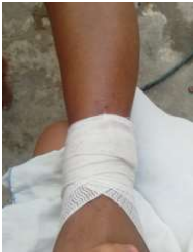
Vendaje en ocho