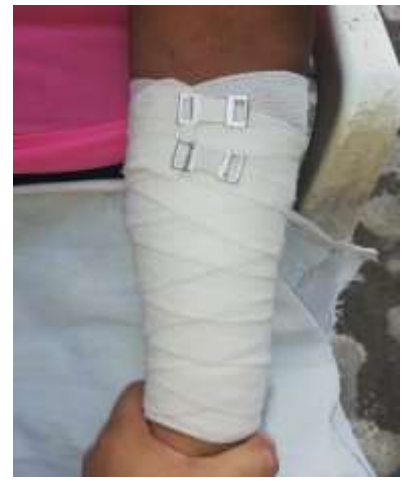
Vendaje en espiral inverso