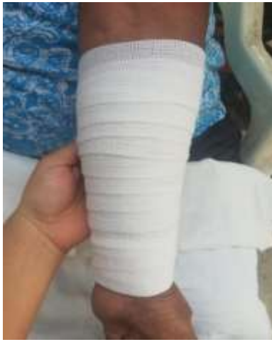
Vendaje en espiral