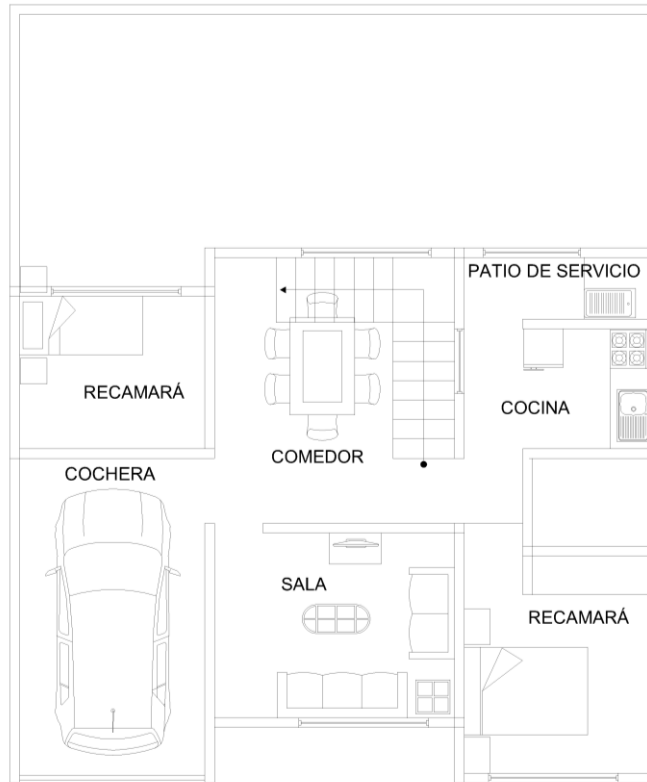
PLANTA ARQUITECTONICA 1

En esta primera propuesta La cochera estaba Unidad al resto del complejo Por lo tanto se debía de techar Esto provocaría que se ampliaría los metros cuadrados permitidos. La recamara estaba alejada del baño haciendo que el usuario tuviera que caminar más Y la cocina estaba en un lugar poco viable. Estos son los errores más notorios dentro de la primera propuesta.