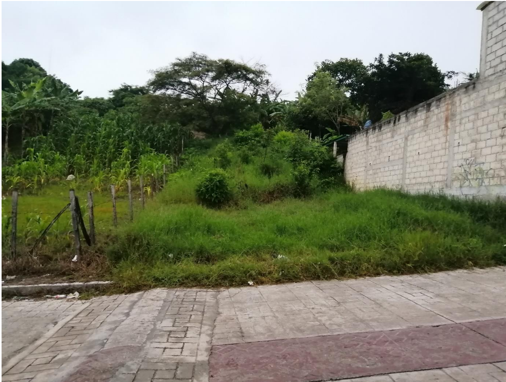
Paisaje alrededor del predio