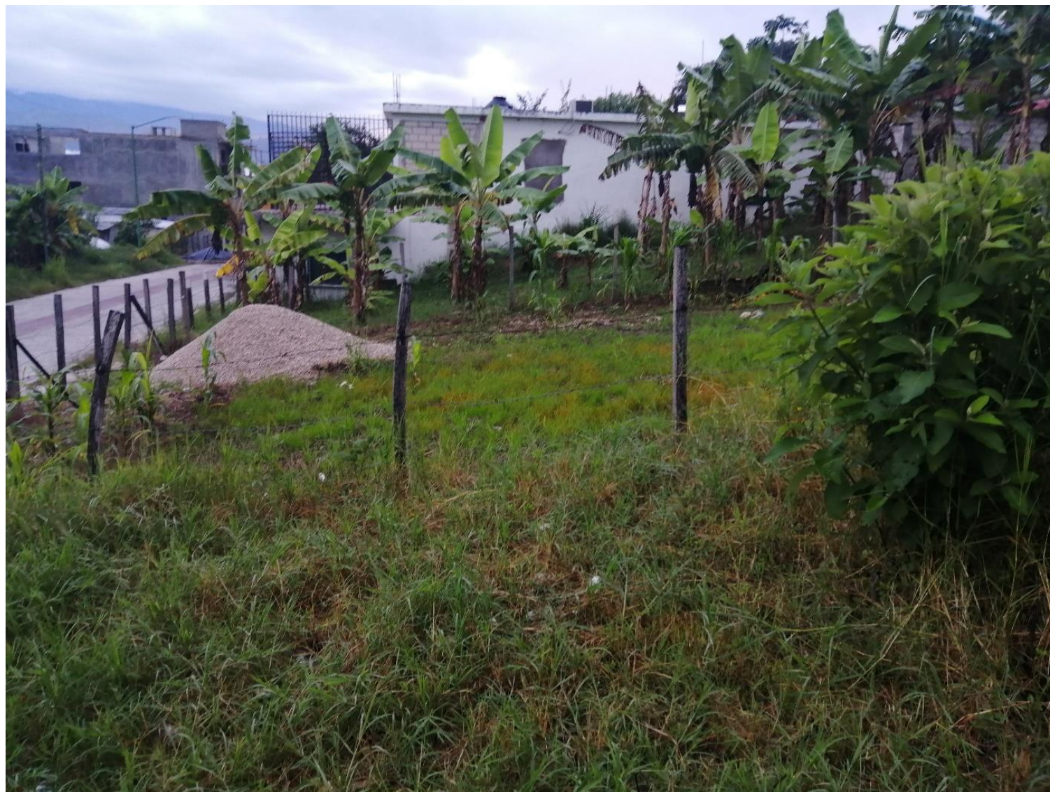
Imagen tomada por Adrian Alvarez 2020