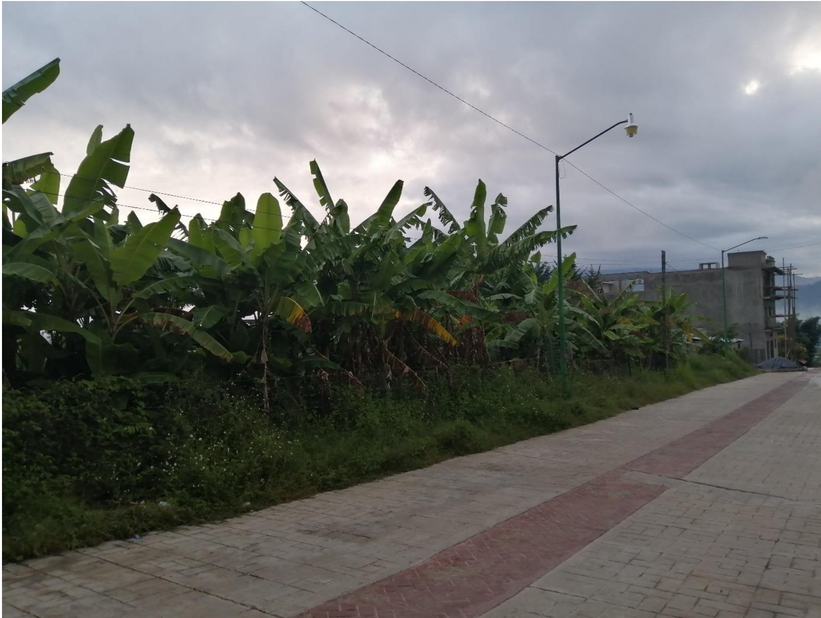
Paisaje alrededor del predio Imagen tomada por Adrian Alvarez 2020