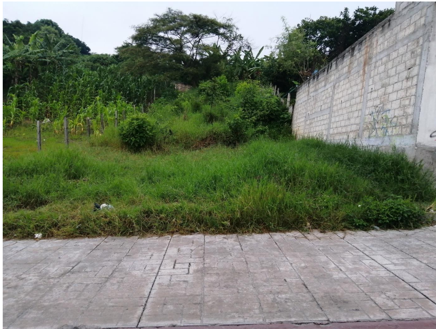
Imagen tomada por Adrian Alvarez 2020