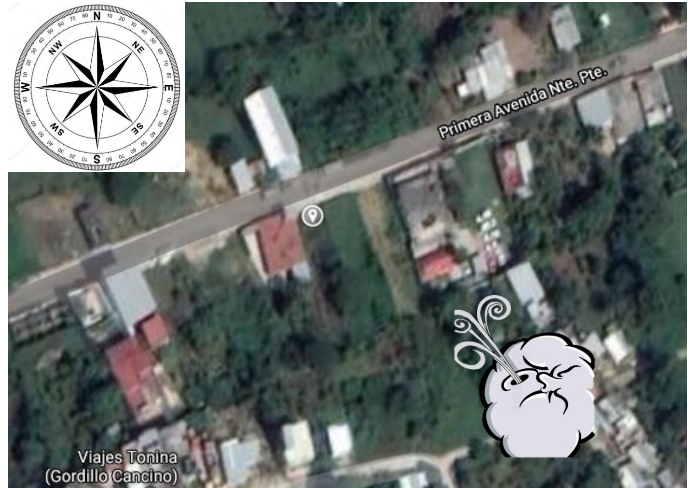
Imagen tomada desde google maps 2020