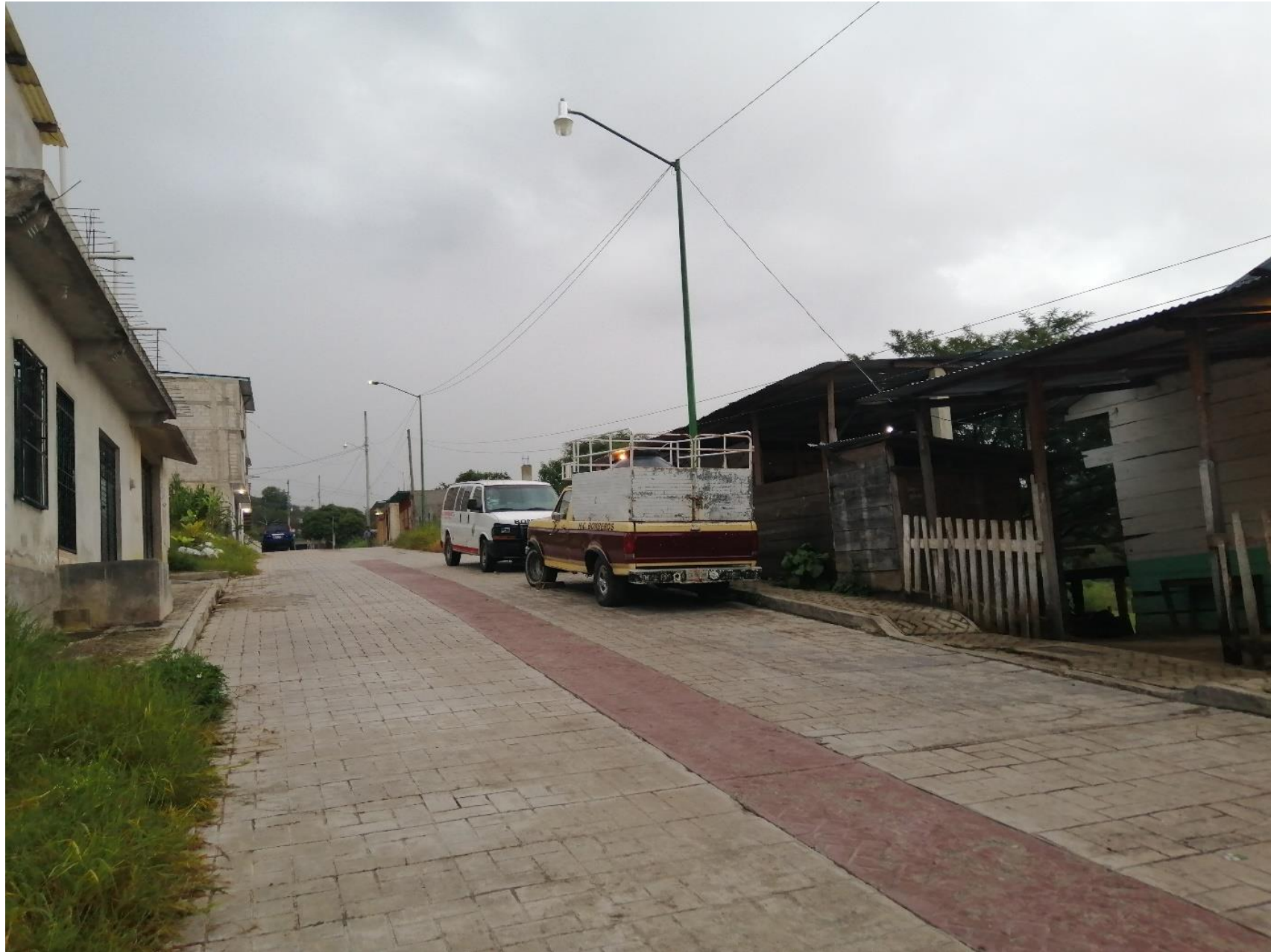
Paisaje alrededor del predio 2020