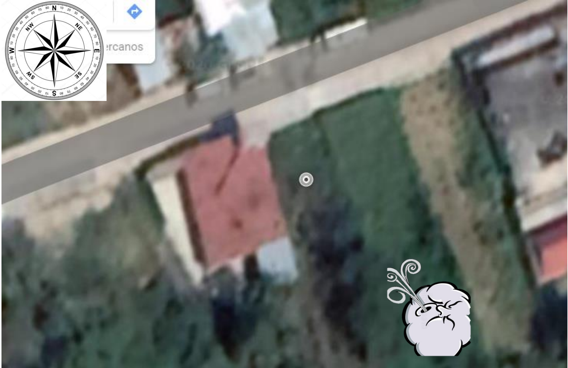
Imagen tomada desde google maps 2020