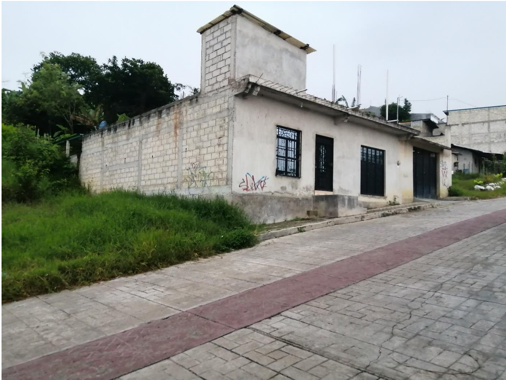
Paisaje alrededor del predio