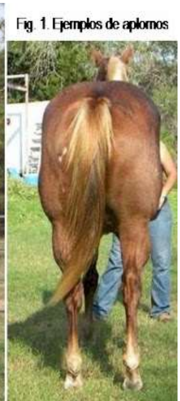
Fig. 1. Ejemplos de aplomos