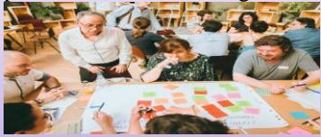
Diagrama de ishikawa: es un método gráfico de representación y delimitación de problemas

El impacto del futuro: la técnica que somete a unos posicionamientos ideológicos.