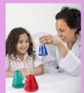
El maestro orienta el proceso de aprendizaje