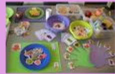
Recursos didácticos diversos