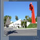
Navarín, un lugar en la Riviera Navarín

Las oportunidades en Loreto-Nopoli-Puerto Escondido tienen tantos contrastes como su belleza natural sin precedentes, se cuenta con productos artesanales entre otros: artesanías, y multiculturales.