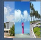
Playa Espíritu, la joya de Sinaloa

Su aeropuerto internacional recibe a casi 600 mil turistas entre nacionales e internacionales al año. Cuenta con 11 rutas y 27 vuelos provenientes de Canadá y Estados Unidos.