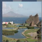
Loreto, cuerpo y espíritu en el mar y en la montaña

El segundo aeropuerto internacional con mayor recepción de turistas extranjeros al año en México, ya tiene en cuenta con la autopista Transpeninsular, el puerto de Cabo San Lucas ocupa el segundo lugar en recepción de cruceros en el Pacífico Mexicano.