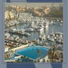
Los Cabos, el lujo de mirar dos mares

Ixtapa, un paraíso único para la inversión.