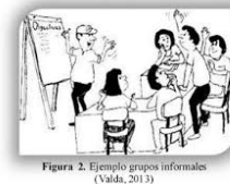
Figura 2. Ejemplo grupos informales (Valda, 2013)