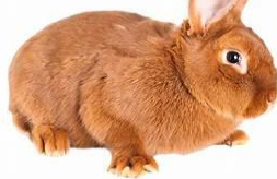
El conejo neozelandés

La característica principal de esta raza es su color gris salpicado de pelos negruzcos, similares a los de las chinchillas.