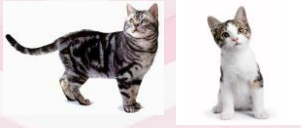
Razas de pelo cortó