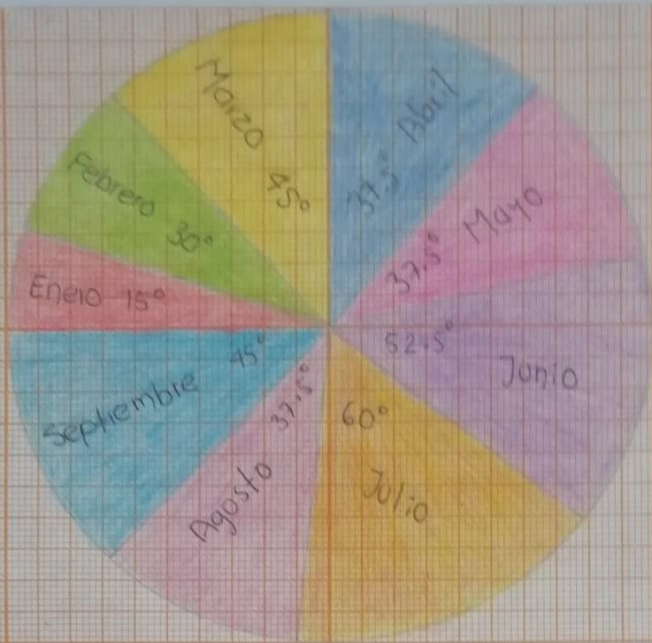
Gráfica con porcentaje y grados